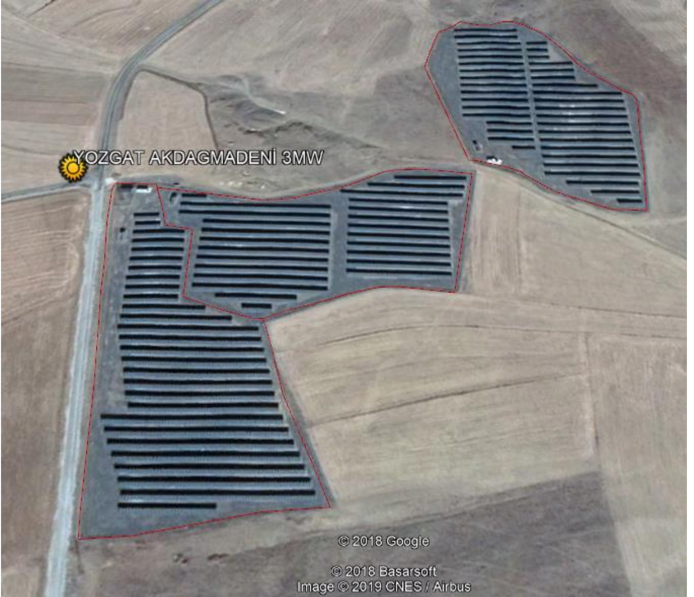
* Yozgat Santral Görüntüsü