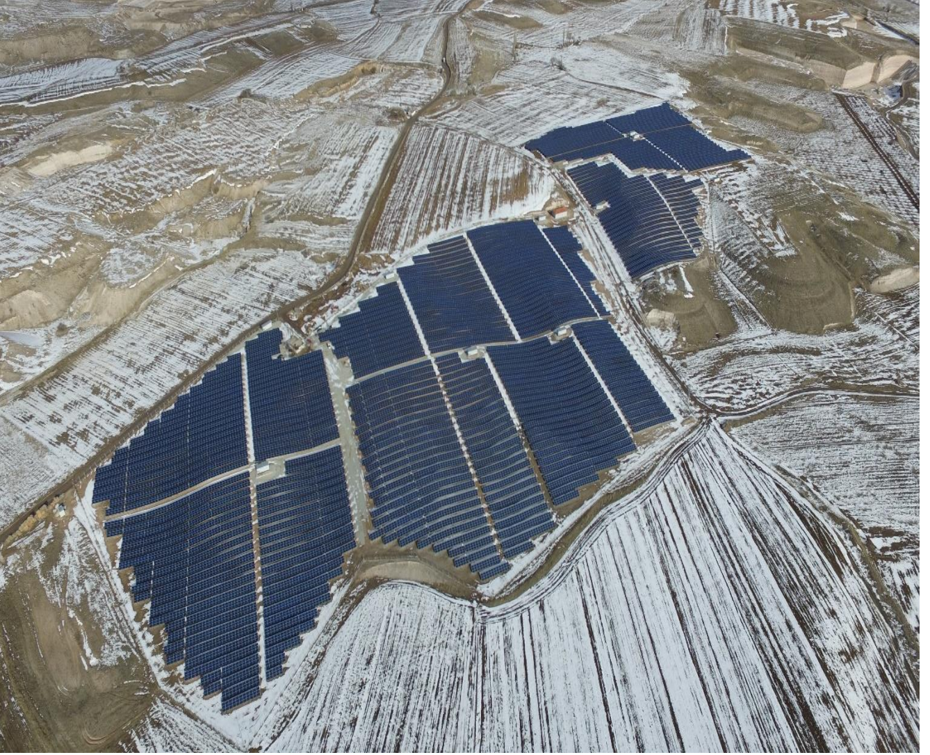
* Nevşehir Santral Görüntüsü