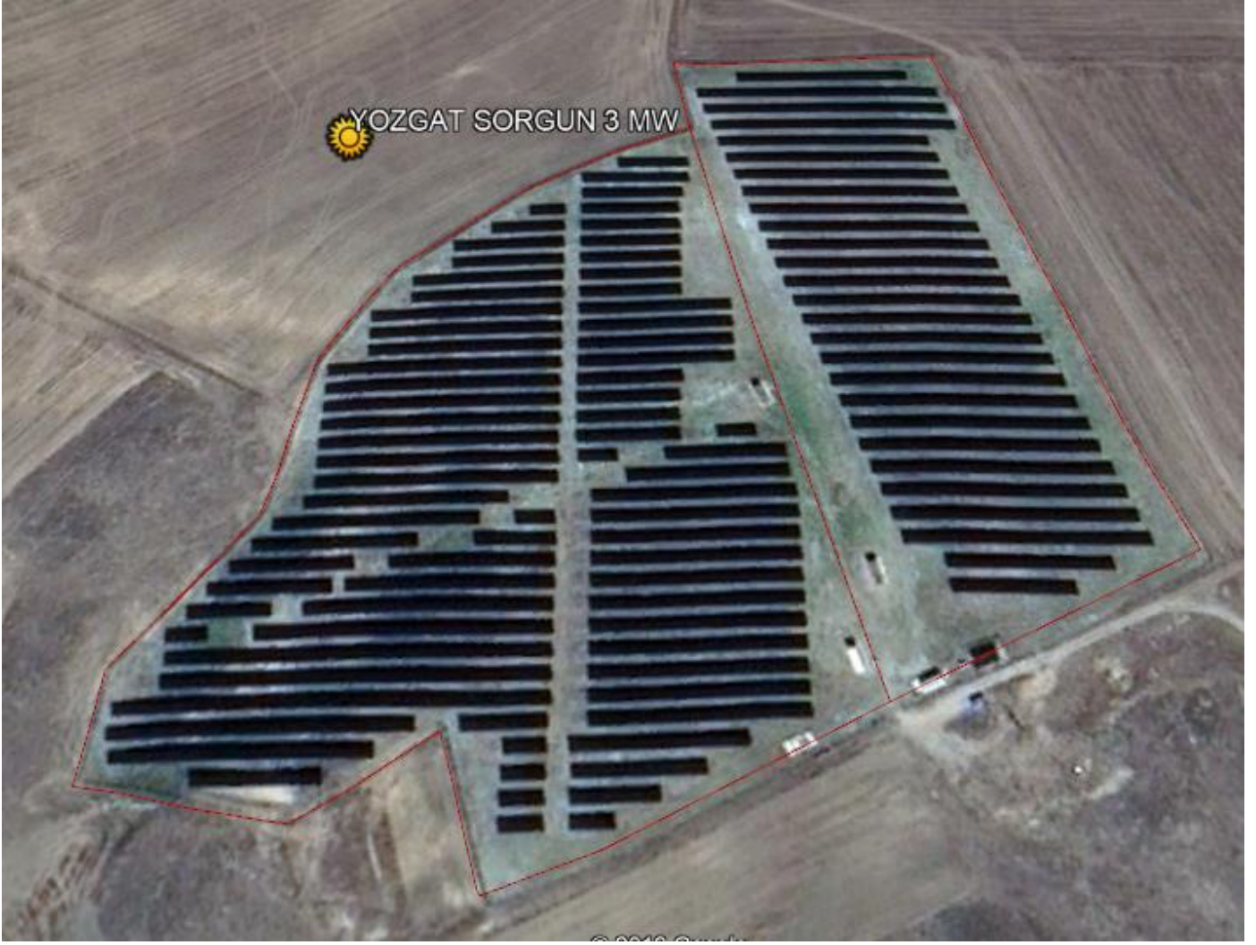
* Yozgat Santral Görüntüsü