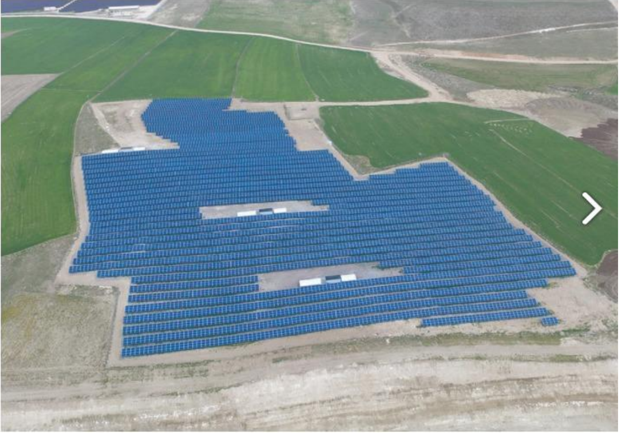
Afyon Sinanpaşa santral görüntüsü