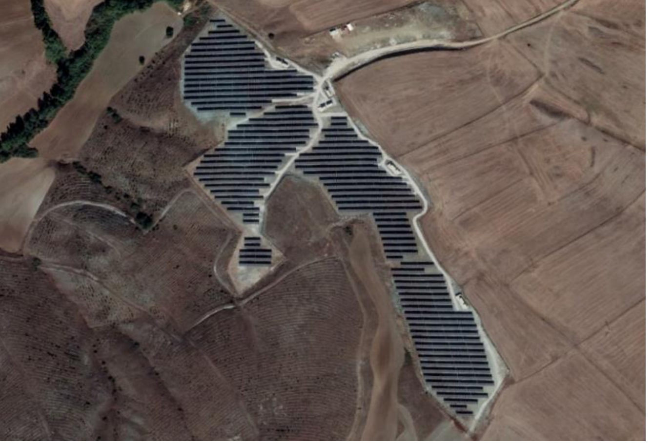
*Bilecik Santral Görüntüsü